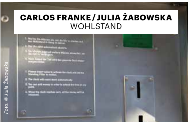
CARLOS FRANKE / JULIA ŻABOWSKA WOHLSTAND