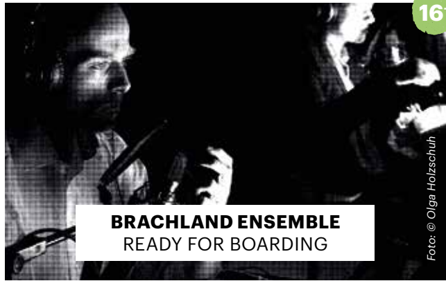
BRACHLAND ENSEMBLE READY FOR BOARDING

Mit freundlicher Unterstützung des Hessischen Ministeriums für Wissenschaft und Kunst und der Stadt Marburg.