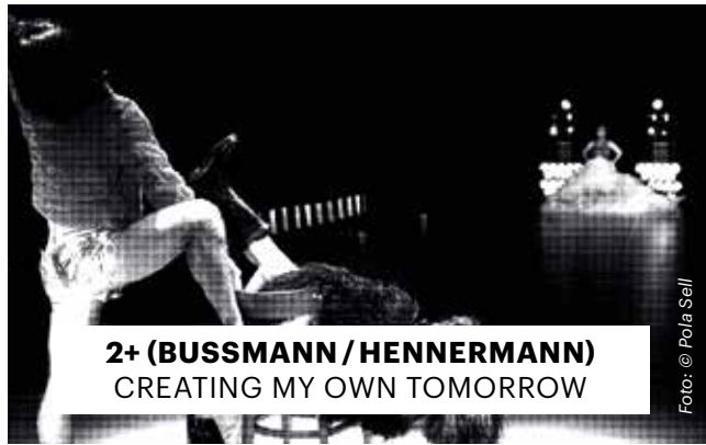
2+ (BUSSMANN / HENNERMANN) CREATING MY OWN TOMORROW

Eine Flinn Works Produktion in Koproduktion mit Sophienseale Berlin. Gefördert aus Mitteln des Regierenden Bürgermeisters von Berlin – Senatskanzlei – Kulturelle Anwesenheiten, des Fonds Darstellende Künste e.V. und des Hessischen Ministeriums für Wissenschaft und Kunst und des Kulturrats der Stadt Kassel.