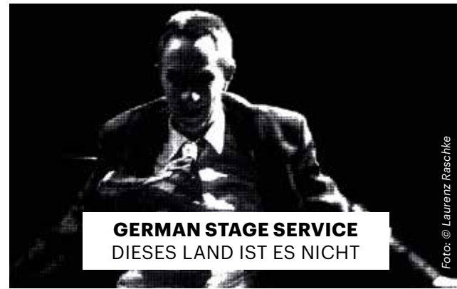
GERMAN STAGE SERVICE DIESES LAND IST ES NICHT

Eine Koproduktion mit dem Künstlerhaus Mousonturm Frankfurt. Das Projekt wurde ausgezeichnet im Rahmen der Crowdfunding-Initiative »kulturMute« der Aventus Foundation. Mit freundlicher Unterstützung des Kulturrats der Stadt Frankfurt, dem Hessischen Ministerium für Wissenschaft und Kunst, der Naspä-Stiftung und der Gerda-Weiler-Stiftung e.V.