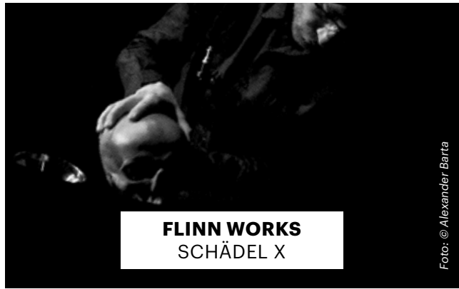
FLINN WORKS SCHÄDEL X

Gefördert vom Kulturrat Kassel und vom Hessischen Ministerium für Wissenschaft und Kunst sowie der Sebastian-Cobler-Stiftung. Eine Koproduktion mit der Tafelhalle Nürnberg.