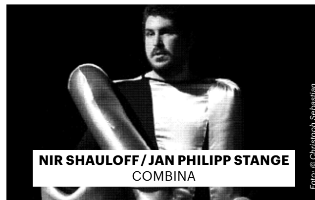
NIR SHAULOFF / JAN PHILIPP STANGE COMBINA

Gefördert vom Kulturamt Kassel und vom Hessischen Ministerium für Wissenschaft und Kunst sowie der Sebastian-Cobler-Stiftung. Eine Koproduktion mit der Tafelhalle Nürnberg.