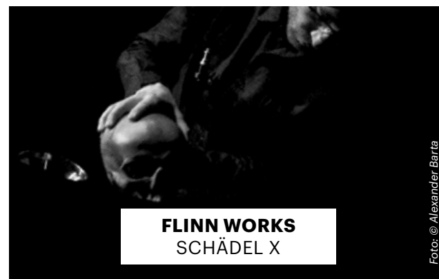
FLINN WORKS SCHÄDEL X

Der erste Teil der Projektentwicklung entstand im Rahmen der Einstiegsförderung des Regierenden Bürgermeisters von Berlin – Senatskanzlei – Kulturelle Angelegenheiten. Das Gesamtprojekt ist gefördert durch die Hessische Theaterakademie und die Gießener Hochschulgesellschaft, in Koproduktion mit dem Künstlerhaus Mousonturm und den Sophiensaealen Berlin. Mit freundlicher Unterstützung von Tanzfabrik Berlin und ada Studio.