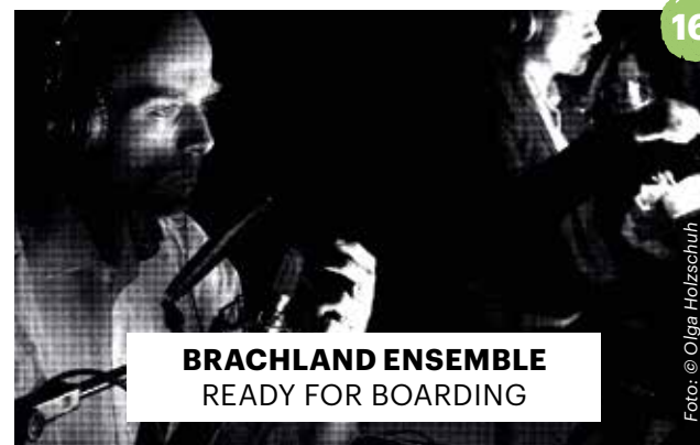
BRACHLAND ENSEMBLE READY FOR BOARDING

Eine Flinn Works Produktion in Koproduktion mit Sophiensaele Berlin. Gefördert aus Mitteln des Regierenden Bürgermeisters von Berlin – Senatskanzlei – Kulturelle Angelegenheiten, des Fonds Darstellende Künste e.V. und des Hessischen Ministeriums für Wissenschaft und Kunst und des Kulturamts der Stadt Kassel.