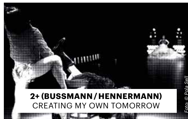
2+ (BUSSMANN / HENNERMANN) CREATING MY OWN TOMORROW

Eine Koproduktion mit dem Künstlerhaus Mousonturm Frankfurt. Das Projekt wurde ausgezeichnet im Rahmen der Crowdfunding-Initiative »kulturMut« der Aventis Foundation. Mit freundlicher Unterstützung des Kulturamts der Stadt Frankfurt, dem Hessischen Ministerium für Wissenschaft und Kunst, der Naspä-Stiftung und der Gerda-Weiler-Stiftung e.V.